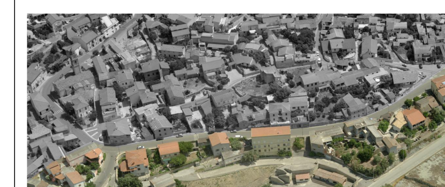
PIANO PARTICOLAREGGIATO DEL CENTRO DI ANTICA E PRIMA FORMAZIONE IN ADEGUAMENTO AL PIANO PAESAGGISTICO REGIONALE